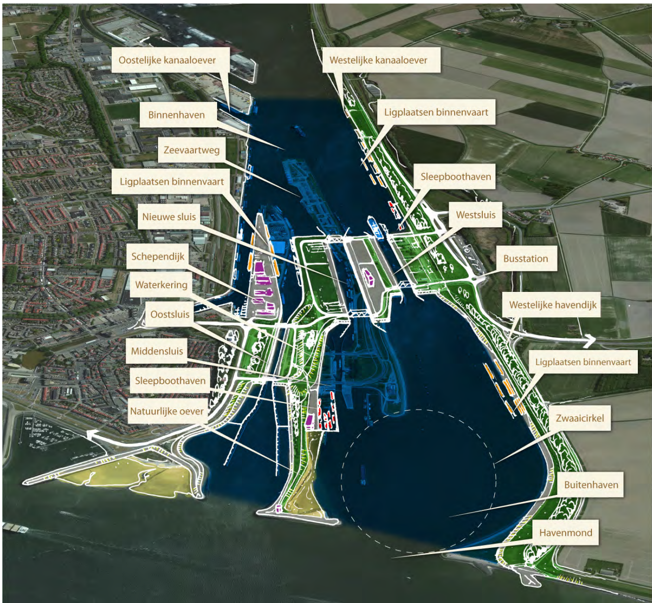
Figuur 0-3: Verklaring gebruikte begrippen De ondergrond is gebaseerd op de voorkeursvariant